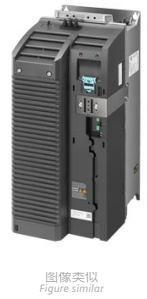
图像类似 Figure similar