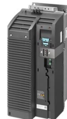
图像类似 Figure similar