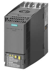
图像类似 Figure similar