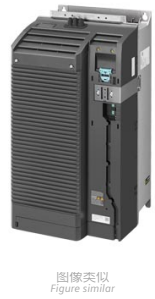
图像类似 Figure similar